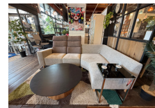
・イメージデザイン社 店舗/住宅/商業施設/ホテル/新築・設計・デザイン