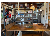
・家具屋沖縄店 家具家電販売買取/製作/レンタル/リメイク