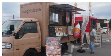
【↑ 去年の2周年祭の様子】