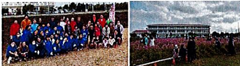
コスモス満開時期：1月下旬～2月初旬

11月に会員事業所の皆さま・地元中学生と共にコスモスの種まきをしました。コスモス開花期間中は観光客だけでなく、県内からも多くの方が来場されました！